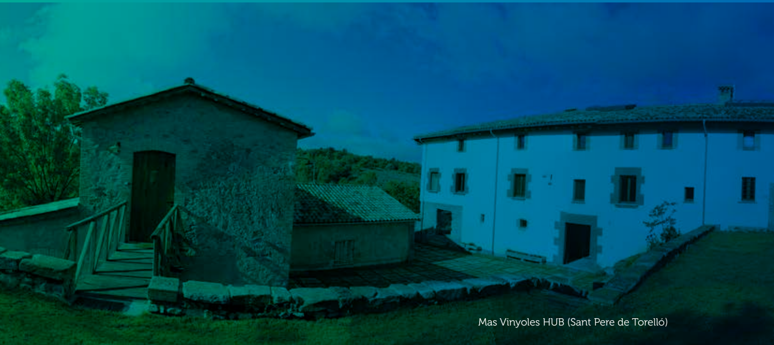
Mas Vinyoles HUB (Sant Pere de Torelló)